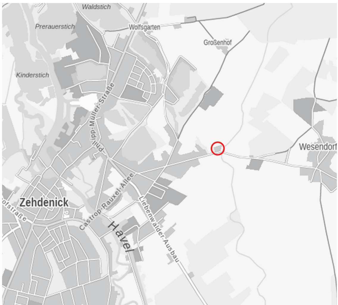
Abb. 1: Lage des Plangebietes im Stadtgebiet, o.M.

Nördlich, östlich und westlich grenzt unmittelbar an den räumlichen Geltungsbereich das Landschaftsschutzgebiet "Fürstenberger Wald- und Seengebiet" an.