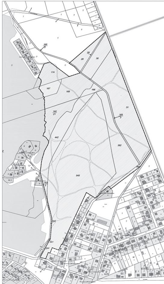
----- Abgrenzung Geltungsbereich