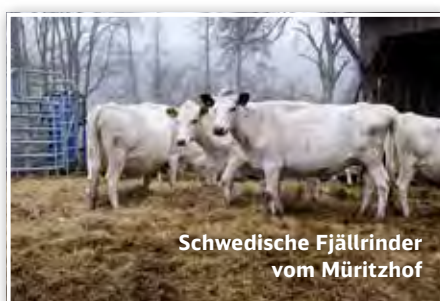
Schwedische Fjällrinder vom Müritzhof

Mehr Informationen und Fotos auch auf www.bahn.de/treibgut